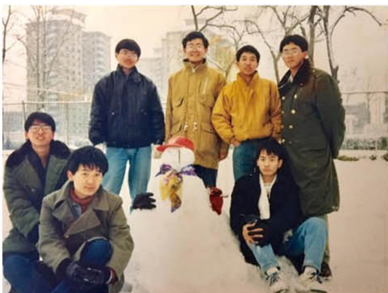
堆雪人的大老爷们

最后说玩儿。香港有一部影片叫《志明与春娇》，是余文乐和杨千嬅主演的，特别喜欢。男主角志明每次买冰淇淋的时候都要两个小时的干冰，其实不是为了保存冰淇淋，而是喜欢把干冰倒进马桶，看马桶里的云雾缭绕，并且拉着杨千嬅扮演的春娇一起看，一起乐。这就是青春，以及伴随青春一起跃动的激情。大学时，我们也有一样的激情。我们曾经三天两夜从学校往返十渡，骑着自行车；我们曾醉心于铁研的录像和国图的老电影，一行七人，浩浩荡荡，进入影院，而不是成双结对；我们也曾一起在雪地里堆雪人，还给它系上花围巾。可20年后的今天，就再也不可能了。什么都能重来，只有青春一去不再。这么多事情，和青春搅合在一起就是美好，离开青春，就是傻帽。看看我们当初的美好吧。