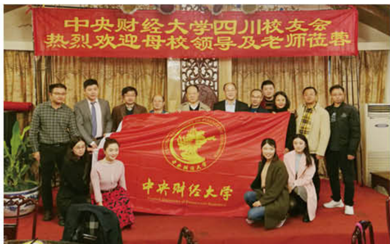
向四川校友会第四届领导班子赠校旗

召开表示热烈祝贺，对此次改选结果给予了充分肯定。她表示，四川校友会成立早、发展快，团结友爱、热情阳光，凝聚力、战斗力、执行力强，是所有中财四川校友的精神家园和心灵港湾，希望在新一届校友会班子的带领下，四川校友会能够实现跨越式发展、更好地服务四川校友，继续加强与总会的联系与交流。安秘书长还向大家介绍了近年来中财校友会工作取得的长足进步，截至目前，校友总会已经在海内外成立了78个校友会组织，聘任了230余名校友大使，中财校友基本可以在全球各地找到自己的组织；学校教育基金及校友企业蓬勃发展，为校友和母校事业的发展提供了服务和支撑，也为中财精神的传承做出了积极贡献；校友总会及各地校友会开展了形式多样、内容丰富的论坛活动，虚实结合，真正实现了相互支持、相互帮助、共同发展。最后，安秀梅秘书长祝四川校友会蒸蒸日上，祝四川校友们幸福安康、生活和美，祝本次大会圆满成功！