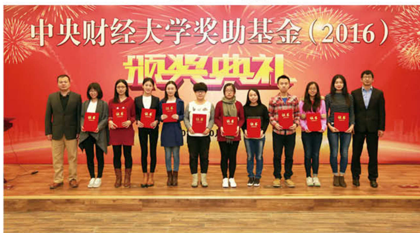
学校学生奖学金颁奖