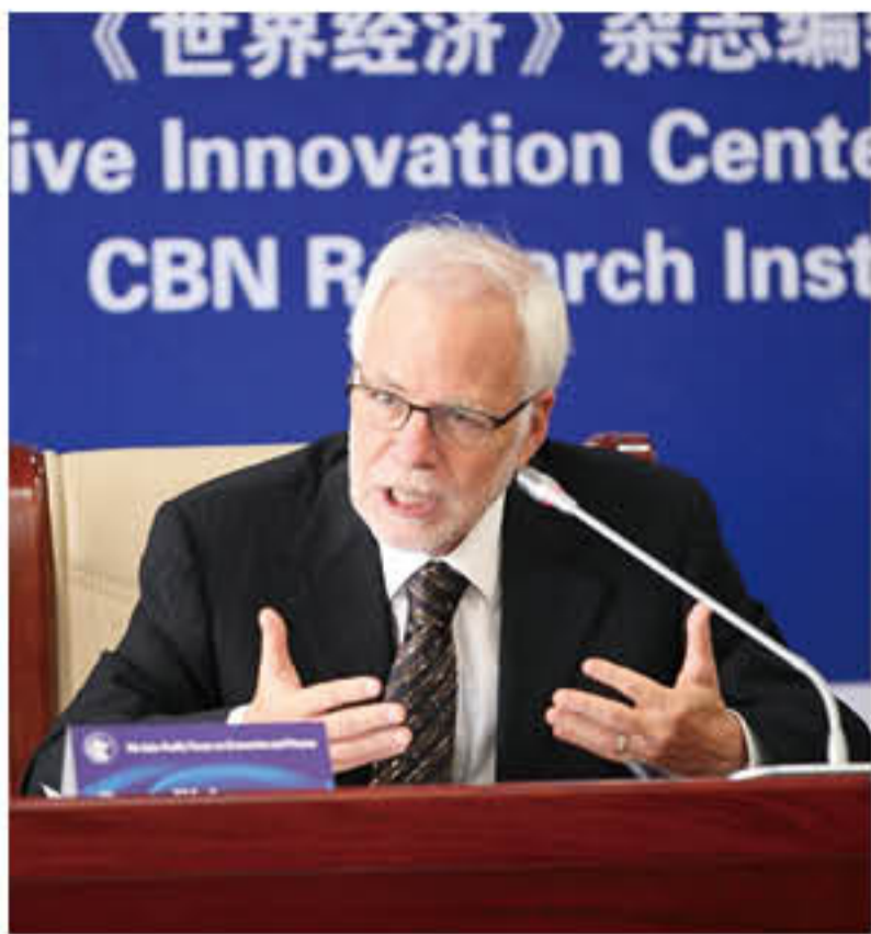
Barry Eichengreen 教授主旨演讲

合与一体化会给人类带来更大的繁荣和更多的发展机会。然而值得关注的是，近年来经济全球化正遇到很多严峻的挑战，如金融动荡频繁发生、收入差距扩大和难民问题等。这些挑战有可能导致全球化出现退潮。为了确保经济全球化继续健康发展，各国必须加强沟通和合作，不断完善基于多边主义的全球经济和金融治理框架，避免孤立主义和极端利己主义的倾向。本届论坛将集中讨论全球宏观经济治理问题，重点关注这一领域面临的挑战和应对对策，具体包括三个方面的议题：一是加强国际宏观经济政策协调，减缓主要经济体货币政策的溢出效应，加强财政政策和其他宏观经济政策的作用；二是面对全球金融周期冲击，积极应对全球范围内的安全资产荒，加强国际资本流动的有效管理；三是继续积极推进国际金融架构改革，包括 IMF 治理机制改革、SDR 作用的提升和人民币加入 SDR 货币篮子的影响评估等。这些问题将在本次论坛上获得深入讨论，期待各位嘉宾的精彩观点和深度分析。