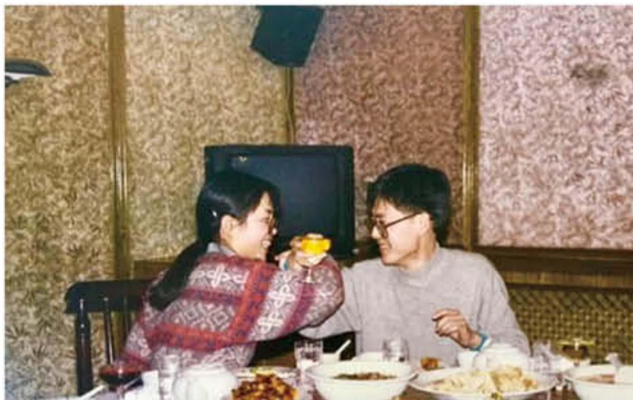
美满就是这个样子

再说喝。吃喝不分家，聚餐有时也喝点小酒。酒也不是什么好酒，也就燕京和二锅头。高兴的时候喝点儿，不痛快的时候也喝点儿。还真是喝一点儿，大学四年我没喝多过。当然宿舍里也有喝多的哥们，为了追不到手的姑娘。追不到心爱的姑娘，心必是痛的。痛的忍受不了了，就喝点酒想摆脱这痛。可喝多了，心就更痛了，万般过往涌上心头，撕心裂肺一般。看着兄弟踉跄着被扶回宿舍，趴在