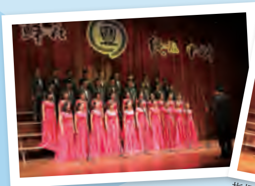
我校大学生合唱团