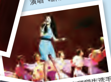
蒙古留学生选手 演唱《荷塘月色》