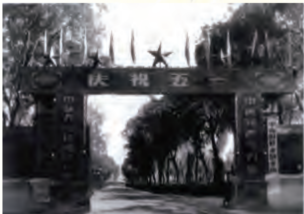
中央财政金融学院60年代校门