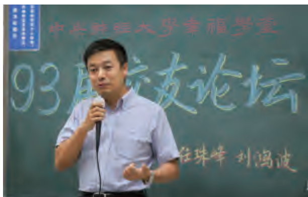
任珠峰校友精彩演讲