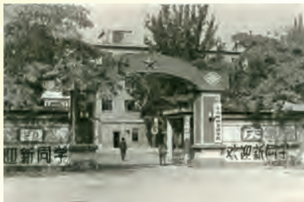
1978年中央财政金融学院复校后校门