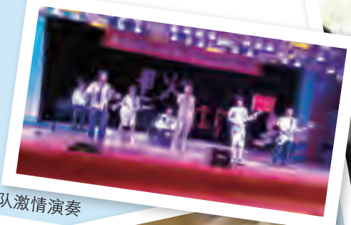
北航乐队激情演奏