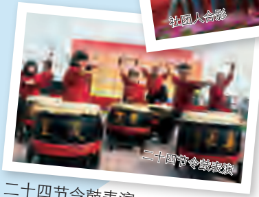
二十四节令鼓表演